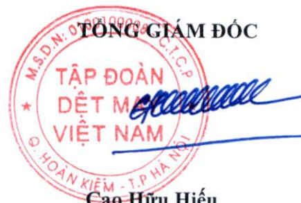
Cao Hữu Hiếu